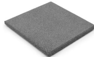
tasainen pohja sisätiloihin